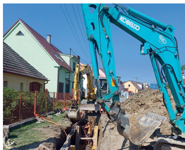
Oprava kanalizace v ul. Nádražní