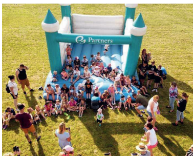
Rozloučení s prázdninami v Čenkově

pro Čenkov, Dobřejiice, Lány, Malšice, Maršov, Oboru, Třebelice, Všechlapy